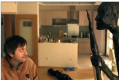
Court Métrage Nominé Clermont-Ferrand SKOK (Jump) réalisé par Petar Valchanov & Kristina Grozeva Bulgarie 2012, fiction, 30 min