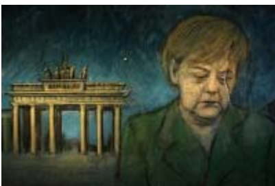
Court Métrage Nominé Tampere SONNTAG 3 (Sunday 3) réalisé par Jochen Kuhn Allemagne 2012, animation, 14 min