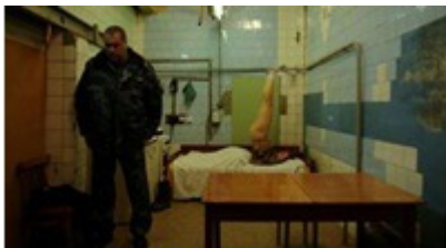
Court Métrage Nominé Grimstad YADERNI WYDHODY (Nuclear Waste) réalisé par Myroslav Slaboshpytskiy Ukraine 2012, fiction, 25 min