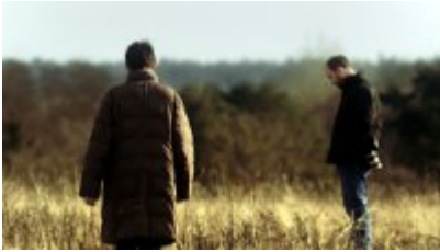
Court Métrage Nominé Cork MORNING réalisé par Cathy Brady Royaume-Uni/Irlande 2012, fiction, 21 min