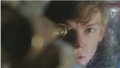
Court Métrage Bristol ORBIT EVER AFTER réalisé par Jamie Stone Royaume-Uni 2013, fiction, 20 min