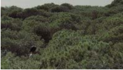
Court Métrage Nominé Berlin MISTERIO (Mistery) réalisé par Chema García Ibarra Espagne 2013, fiction, 12 min