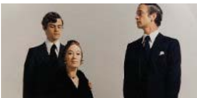
Court Métrage Nominé Sarajevo A STORY FOR THE MODLINS réalisé par Sergio Oksman Espagne 2012, documentaire, 26 min