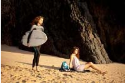
Court Métrage Nominé Gand AS ONDAS (The Waves) réalisé par Miguel Fonseca Portugal 2012, fiction, 22 min