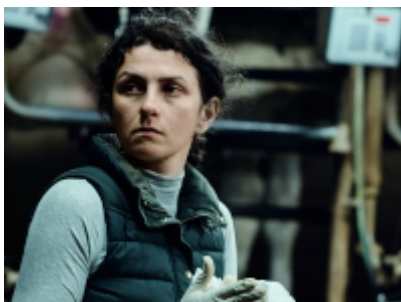
Court Métrage Nominé Cork CONTAINER KONTENER de Sebastian Lang Allemagne, fiction, 30 min