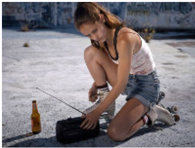
Court Métrage Nominé Vila do Conde AQUAPARQUE de Ana Moreira Portugal, fiction, 16 min