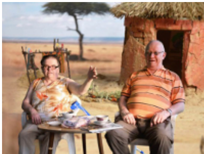
Court Métrage Nominé Berlin BURKINA BRANDENBURG KOMPLEX de Ulu Braun Allemagne, fiction/expérimental, 19 min