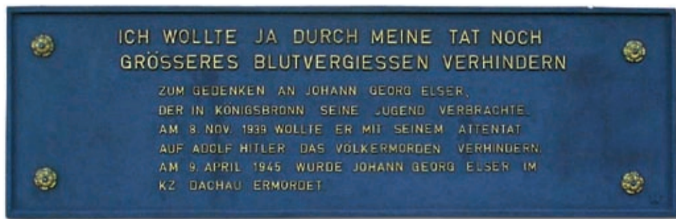
Il faut attendre les années 1990 pour que Königsbrunn, la ville natale d'Elser, honore la mémoire de celui qui, comme on peut le lire sur la plaque, « voulait empêcher que plus de sang encore ne soit versé ».

© Extrait de la note de production : conversation avec les auteurs (Léonie-Claire et Fred Breinersdorfer) et les producteurs (Boris Ausserer et Oliver Schündler)