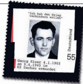
Timbre de la poste allemande commémorant en 2003 le centième anniversaire de la naissance de Georg Elser. Il est cité en haut du timbre « j'ai voulu empêcher la guerre ».

Elser assume ses actes, ce qui le différencie de nombreux partisans du « gouvernement terroriste » au pouvoir, alimenté par la peur et l'ambition, qui ont par la suite déclaré avoir suivi les ordres sans se poser de questions. Elser n'est pas un terroriste, mais un combattant de la résistance et les nazis le savaient bien. Ils l'ont assassiné le 9 avril 1945, quelques semaines seulement avant la fin du régime nazi, le même jour que Bonhoeffer, Canaris, Sack et Dohnanyi. Ce fut un réel défi pour la société allemande, qui soutenait aveuglement le régime d'Hitler, de comprendre l'acte d'Elser comme un acte de résistance à un gouvernement terroriste.