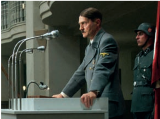
Texte du Dr Peter Steinbach, Directeur scientifique du Mémorial de la résistance allemande à Berlin.

LE PARTI NATIONAL-SOCIALISTE A MENÉ UN COMBAT, TANT CONTRE LES ENNEMIS EXTÉRIEURS QU’INTÉRIEURS. ILS COMBATTAIENT TOUS CEUX QU’ILS IDENTIFIAIENT COMME ENNEMIS QUE CE SOIT POUR DES RAISONS RACIALES OU MORALES. LES CONSIDÉRANTS COMME DES PARTISANS DU « MAL ABSOLU ». AU MILIEU D’UNE GUERRE QU’IL N’A PAS CHOISIE, LE PEUPLE ALLEMAND N’AURAIT PU SE LIBÉRER QU’EN RETOURNANT LES ARMES CONTRE SON PROPRE GOUVERNEMENT. MAIS LE 8 NOVEMBRE 1939, DATE TRÈS VITE OUBLIÉE APRÈS 1945, UN HOMME A ESSAYÉ DE CHANGER LE COURS DE L’HISTOIRE. DEPUIS, SON ACTION A ÉTÉ SOIGNEUSEMENT ANALYSÉE PAR LES HISTORIENS ET, COMPARÉ AUX ANNÉES 50, ELLE EST AUJOURD’HUI LARGEMENT CONNUE.