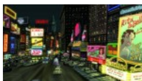
CHICO & RITA , Espagne/Ile de Man réalisé par Tono Errando, Javier Mariscal & Fernando Trueba